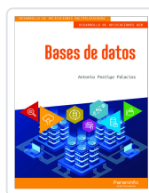
BASES DE DATOS POSTIGO PALACIOS, ANTONIO