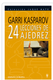
24 LECCIONES DE AJEDREZ KASPAROV, GARI