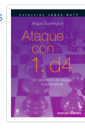
ATAQUE CON 1. D4 DUNNINGTON, ANGUS