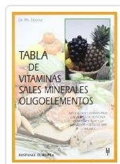
TABLA DE VITAMINAS, SALES MINERALES, OLIGOELEMENTOS DOROSZ, PH.