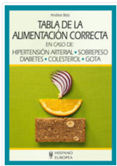
TABLA DE LA ALIMENTACIÓN CORRECTA