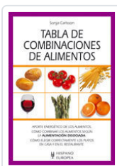
TABLA DE COMBINACIONES DE ALIMENTOS CARLSSON, SONJA