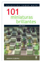
101 MINIATURAS BRILLANTES NUNN, JOHN