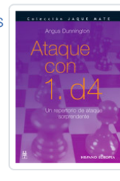
ATAQUE CON 1. D4 DUNNINGTON, ANGUS