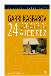
24 LECCIONES DE AJEDREZ KASPAROV, GARI