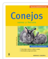
CONEJOS WEGLER, MONIKA