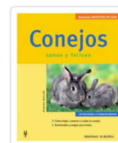
CONEJOS WEGLER, MONIKA