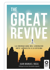
THE GREAT REVIVE ROCA, JUAN MANUEL