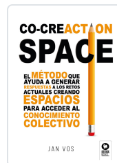
CO-CREATION SPACE VOS, JAN