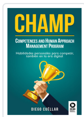
CHAMP CUÉLLAR, DIEGO