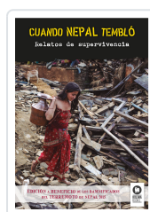
CUANDO NEPAL TEMBLO VARIOS AUTORES