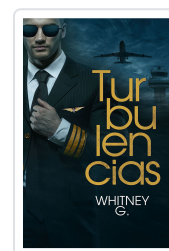
TURBULENCIAS G., WHITNEY