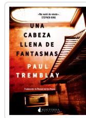
UNA CABEZA LLENA DE FANTASMAS TREMBLAY, PAUL