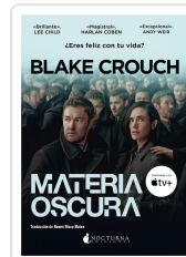
MATERIA OSCURA CROUCH, BLAKE