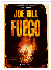
FUEGO HILL, JOE