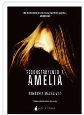
RECONSTRUYENDO A AMELIA MCCREIGHT, KIMBERLY