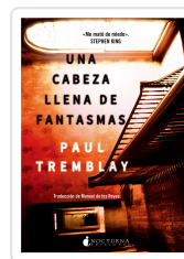
UNA CABEZA LLENA DE FANTASMAS TREMBLAY, PAUL