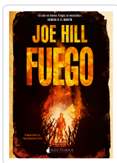
FUEGO HILL, JOE