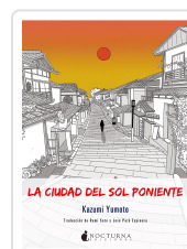
LA CIUDAD DEL SOL PONIENTE YUMOTO, KAZUMI