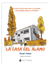
LA CASA DEL ÁLAMO YUMOTO, KAZUMI