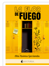
LA FLOR DE FUEGO QUINTAS GARCÍANDIA, ALBA