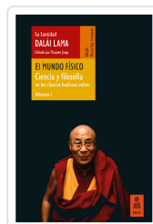
EL MUNDO FÍSICO (CIENCIA Y FILOSOFÍA EN LOS CLÁSICOS BUDISTAS INDIOS, VOL. 1) LAMA, DALÁI