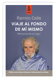
VIAJE AL FONDO DE MÍ MISMO (3ª ED.) CALLE CAPILLA, RAMIRO