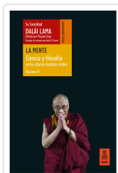
LA MENTE (CIENCIA Y FILOSOFÍA EN LOS CLÁSICOS BUDISTAS INDIOS, VOL. II) LAMA, DALAI