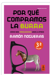
POR QUÉ COMPRAMOS LA BURRA (4ª ED.) NOGUERAS PÉREZ, RAMÓN