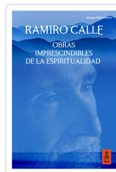
OBRAS IMPRESCINDIBLES DE LA ESPIRITUALIDAD CALLE CAPILLA, RAMIRO