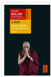
LA MENTE (CIENCIA Y FILOSOFÍA EN LOS CLÁSICOS BUDISTAS INDIOS, VOL. II) LAMA, DALÁI