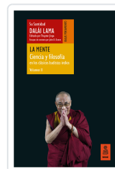
LA MENTE (CIENCIA Y FILOSOFÍA EN LOS CLÁSICOS BUDISTAS INDIOS, VOL. II) LAMA, DALÁI