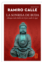
LA SONRISA DE BUDA CALLE CAPILLA, RAMIRO