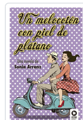
UN MELOCOTÓN CON PIEL DE PLÁTANO ARRANZ MORENO, SONIA