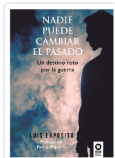
NADIE PUEDE CAMBIAR EL PASADO EXPÓSITO RODRÍGUEZ, LUIS