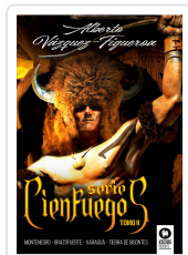
SERIE CIENFUEGOS TOMO II VÁZQUEZ-FIGUEROA, ALBERTO