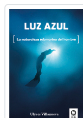
LUZ AZUL VILLANUEVA TOMAS, ULYSES