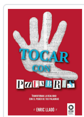
TOCAR CON PALABRAS LLADÓ MICHELÍ, ENRIC