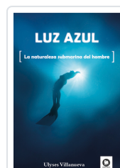
LUZ AZUL VILLANUEVA TOMAS, ULYSES