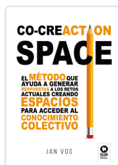
CO-CREATION SPACE VOS, JAN