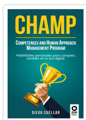
CHAMP CUÉLLAR, DIEGO