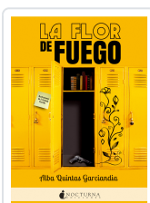
LA FLOR DE FUEGO QUINTAS GARCÍANDIA, ALBA