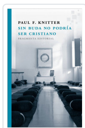
SIN BUDA NO PODRÍA SER CRISTIANO KNITTER, PAUL F.