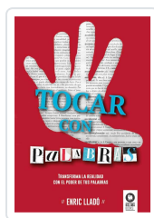
TOCAR CON PALABRAS LLADÓ MICHELÍ, ENRIC