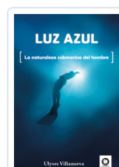
LUZ AZUL VILLANUEVA TOMAS, ULYSES