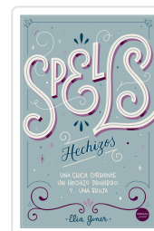
SPELLS (HECHIZOS) GINER, ELIA