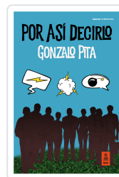
POR ASÍ DECIRLO PITA, GONZALO