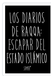
LOS DIARIOS DE RAQQA: ESCAPAR DEL ESTADO ISLÁMICO ISL?MICO SAMER