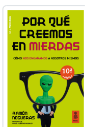
POR QUÉ CREEMOS EN MIERDAS (20ª ED.) NOGUERAS PÉREZ, RAMÓN