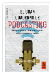
EL GRAN CUADERNO DE PODCASTING IZUZQUIZA MARTÍN, FRANCISCO