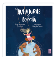
LAS AVENTURAS DE LOLOTA FERNÁNDEZ FERMOSELLE, ÁNGEL