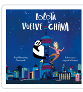
LOLOTA VUELVE A CHINA FERNÁNDEZ FERMOSELLE, ÁNGEL