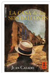
LA CASA DE LOS SEIS BALCONES CASADO FLORES, JUAN