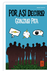
POR ASÍ DECIRLO PITA, GONZALO