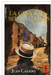
LA CASA DE LOS SEIS BALCONES CASADO FLORES, JUAN