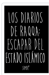
LOS DIARIOS DE RAQQA: ESCAPAR DEL ESTADO ISLÁMICO SAMER