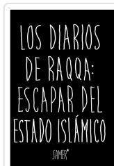
LOS DIARIOS DE RAQQA: ESCAPAR DEL ESTADO ISLÁMICO SAMER