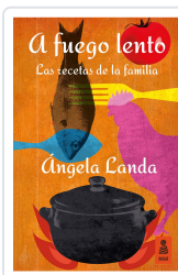
A FUEGO LENTO LANDA APARICIO, ÁNGELA