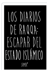
LOS DIARIOS DE RAQA: ESCAPAR DEL ESTADO ISL?MICO SAMER