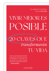
VIVIR MEJOR ES POSIBLE COAUTORIA DE 20 AUTORES