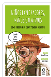
NIÑOS EXPLORADORES, NIÑOS CREATIVOS LÓPEZ BAYARRI, GUZMÁN