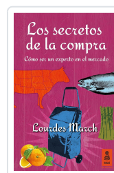
LOS SECRETOS DE LA COMPRA MARCH FERRER, LOURDES