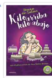
PERRA DE SATÁN, KILO ARRIBA, KILO ABAJO PERRADESATÁN