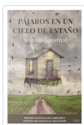
PÁJAROS EN UN CIELO DE ESTAÑO ANTONIO TOCORNAL