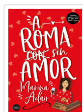
A ROMA SIN AMOR ADAIR, MARINA