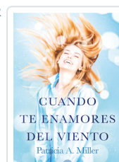
CUANDO TE ENAMORES DEL VIENTO A. MILLER PATRICIA