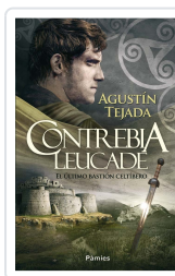
CONTRIBIA LEUCADE TEJADA NAVAS, AGUSTÍN