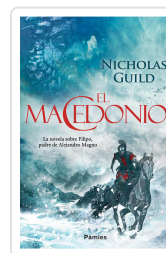
EL MACEDONIO GUILD, NICHOLAS