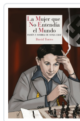
LA MUJER QUE NO ENTENDÍA EL MUNDO TORRES, DAVID