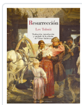
RESURRECCIÓN TOLSTÓI, LEV