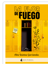
LA FLOR DE FUEGO QUINTAS GARCÍANDIA, ALBA