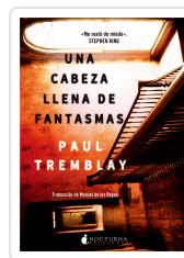
UNA CABEZA LLENA DE FANTASMAS TREMBLAY, PAUL