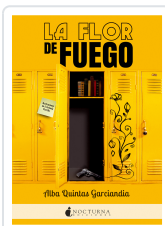
LA FLOR DE FUEGO QUINTAS GARCÍANDIA, ALBA