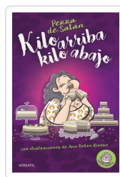
PERRA DE SATÁN, KILO ARRIBA, KILO ABAJO PERRADESATÁN