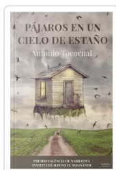
PÁJAROS EN UN CIELO DE ESTAÑO ANTONIO TOCORNAL