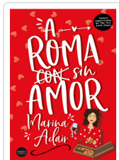
A ROMA SIN AMOR ADAIR, MARINA