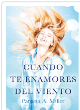
CUANDO TE ENAMORES DEL VIENTO A. MILLER PATRICIA