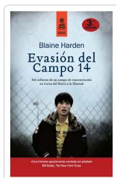
EVASIÓN DEL CAMPO 14 (5ª ED.) HARDEN, BLAINE