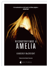
RECONSTRUYENDO A AMELIA MCCREIGHT, KIMBERLY