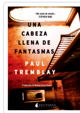
UNA CABEZA LLENA DE FANTASMAS TREMBLAY, PAUL