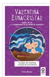
VALENTINA LUNACRISTAL MOLTO, CRIS